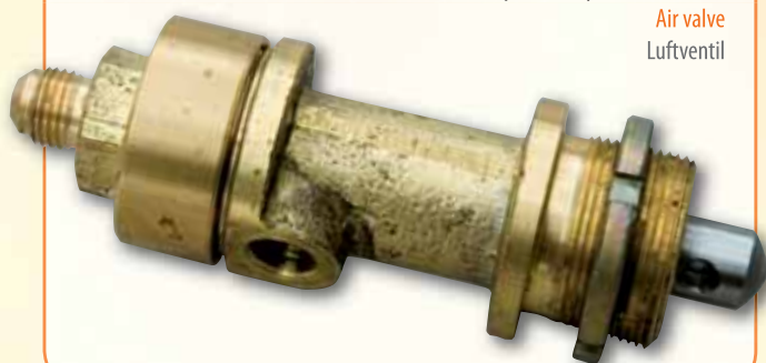
Zawór powietrzny ŻK-51.20.01.01 Air valve Luftventil