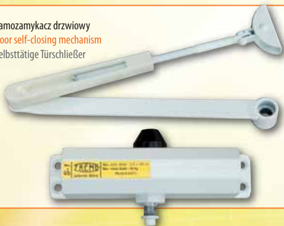
Samozamykacz drzwiowy Door self-closing mechanism Selbsttätige Türschließer