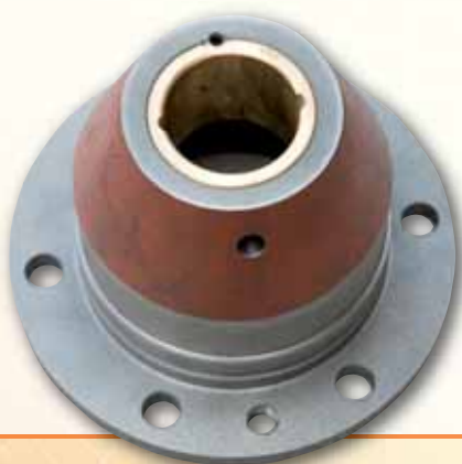
Łożyska szyjne Neck bearings Halslager