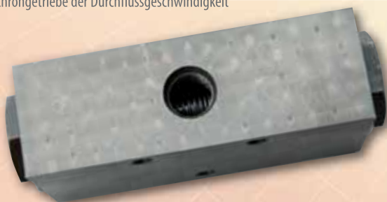
Synchronizator prędkości przepływu ZS1.00B Speed flow synchronizer Synchrongetriebe der Durchflussgeschwindigkeit