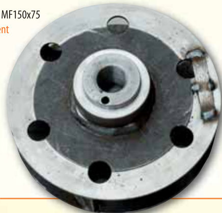
Zbrojenie wirnika MF150x75 Rotor reinforcement Rotorenüstung