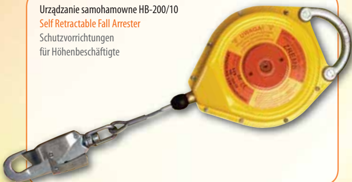
Urządzenie samohamowne HB-200/10 Self Retractable Fall Arrester Schutzvorrichtungen für Höhenbeschäftigte